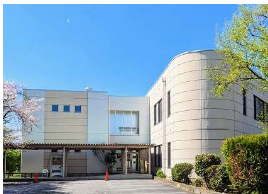
山梨県立大学飯田図書館