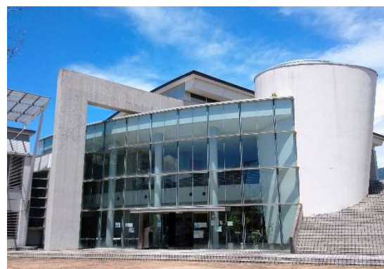
山梨県立大学看護図書館