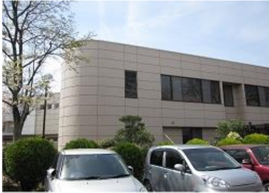
山梨県立大学飯田図書館