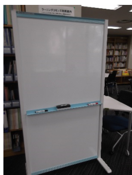
・パーテーション

古本募金を活用して、ラーニングコモンズで活用するパーテーション兼ホワイトボードと、学生用のシュレッダーを購入しました。