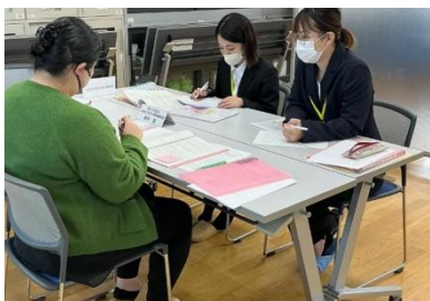
実習指導者との打ち合わせ会

実習指導者と履修生による施設ごとの打ち合わせを行い、実習に向けた課題の確認、実習のイメージ化をしました。