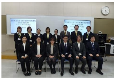
ケースレポート発表会

ケーススタディにより臨地実習で受け持った認知症の人への看護を振り返り、実習における看護実践を客観的かつ論理的にリフレクションしました。看護実践の根拠を深めるとともに、実践の新たな価値や意味づけの気づきになっていました。ケースレポート発表会を通して、履修生同士で意見を交換し、認知症看護観を更に深めることができました。病院実習の実習指導者の方々からの的確かつ温かい講評をいただき、充実した発表会となりました。