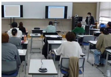
10ヶ月間の振り返り会

10ヶ月間の認定看護師教育課程での学びを振り返り、自己の成長を確認するとともに、今後の認定看護師としての目標や具体的な活動及び課題を発表しました。