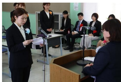
修了生代表の謝辞