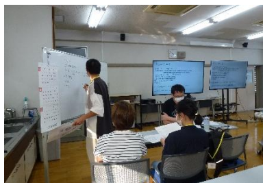
グループワークでの意見交換