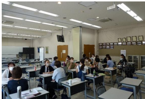
第1回 更新審査・学会発表に向けて(グループワーク)

全体を通して、「普段の自分の考え方や行動を理論的に考えてみる事ができた」「日々の実践を振り返り、新たな知識を得ることができる場として非常にありがたい」「他分野の認定看護の方と話せる貴重な機会だった」といった感想がありました。本研修の目的は概ね達成できたと考えます。