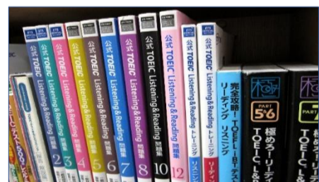
2階就活支援資料コーナー内 TOEIC